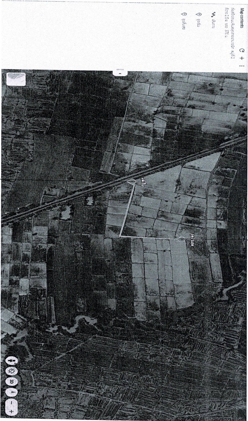
จุดเริ่มต้นโครงการ (0+000)